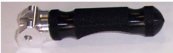
Raste mit Gelenk, vormontiert