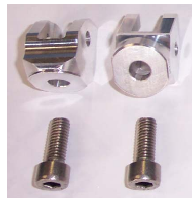
Bsp.: Rastengelenk, Kit