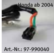
Honda ab 2004