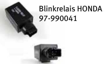
Blinkerrelais HONDA 97-990041

Anmerkung: Das Universalrelais, Art.-Nr.: 97-990034 ist bei der BMW S 1000 RR nicht notwendig, da die Blinker-ansteuerung direkt vom Steuergerät erfolgt!