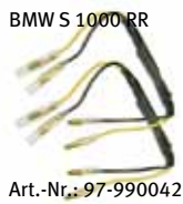
BMW S 1000 RR