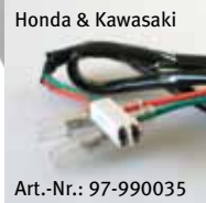
Honda & Kawasaki