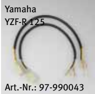
Yamaha YZF-R 125