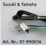
Suzuki & Yamaha